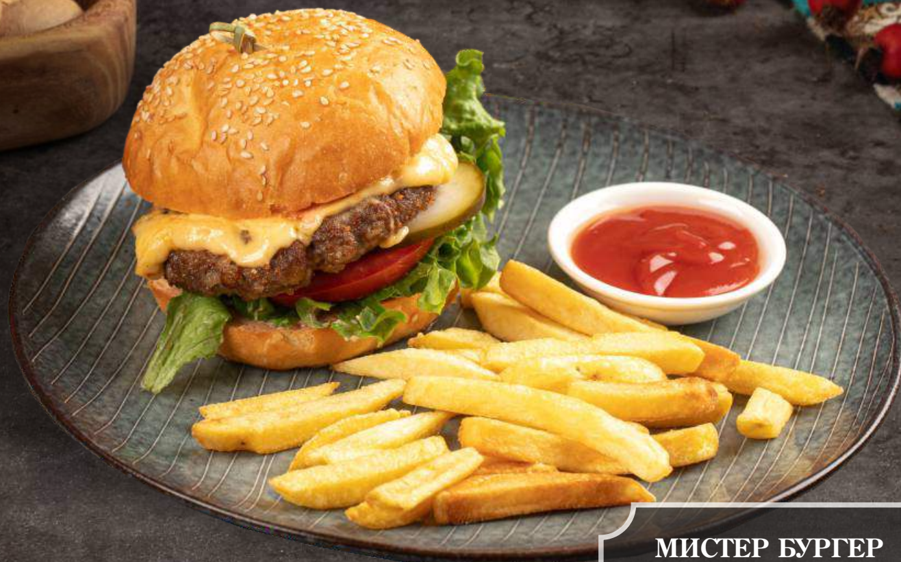
МИСТЕР БУРГЕР 2190