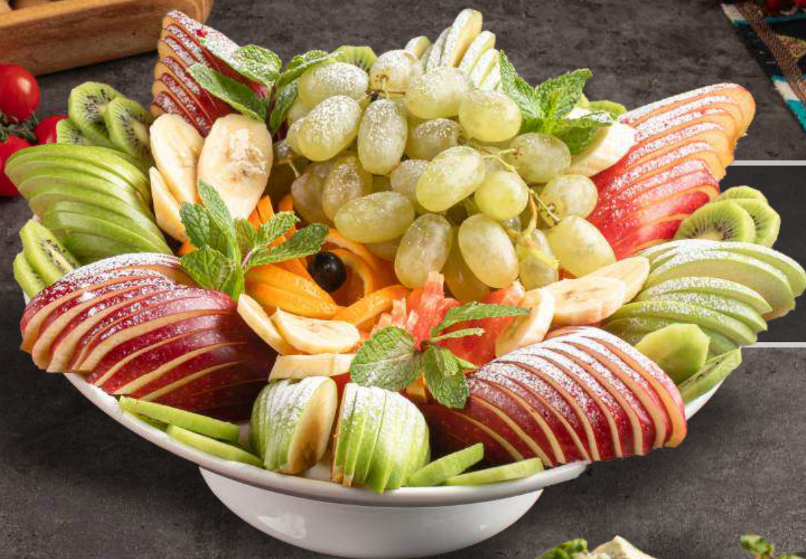
ФРУКТОВОЕ АССОРТИ 5590