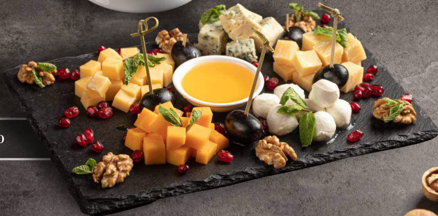
СЫРНОЕ АССОРТИ 4990