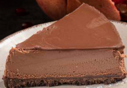
ШОКОЛАДНЫЙ ЧИЗКЕЙК 1990