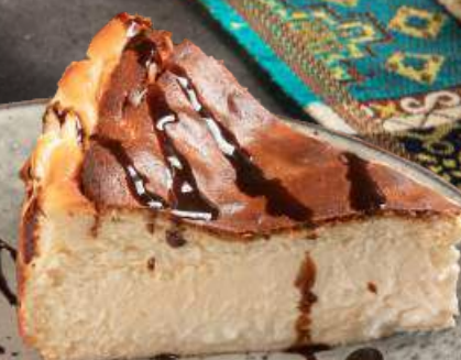
ИСПАНСКИЙ ЧИЗКЕЙК 2390